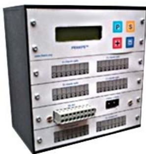
Automate de comptage