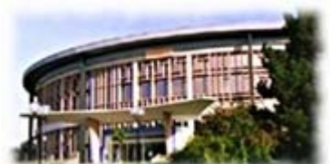
Bibliothèque universitaire de Lille