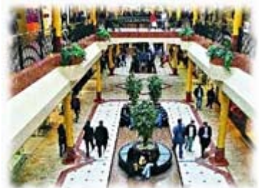
Centre commercial Belle Épine