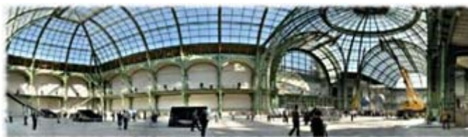
Le Grand Palais à Paris

HEADCOUNT utilise une méthode de comptage brevetée par reconnaissance de modèle. Le compteur gère quatre capteurs installés à hauteur des chevilles. Quand une personne marche dans la zone de comptage, le signal des capteurs est échantillonné pour produire un modèle. Le modèle est alors analysé par le réseau de neurones embarqué qui a été programmé pour compter les visiteurs.